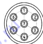
Рис. 1 (схема подключения электропроводки):